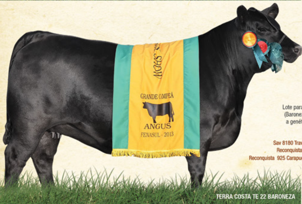
TERRA COSTA TE 22 BARONEZA

Sav 8180 Traveller 004 — Tres Marias Traveller 004 Sav Heavy Hitter 6347 X Tres Marias 6990 Honeto TE Sav Bessie Heiress 1184 — Tres Marias 6116 CRY 4850