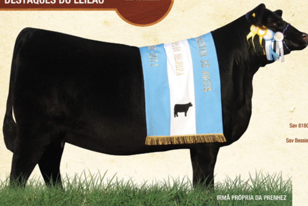
IRMÃ PRÓPRIA DA PREENHEZ